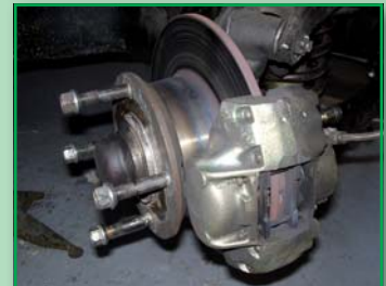
ŠKODA 130 RS - E.Triner, kontrola kotouče a brzdových destiček po Bohemia Rally 2006