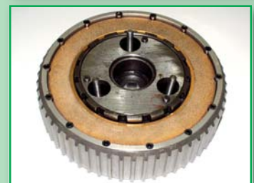
WESLAKE spojka - kompletace