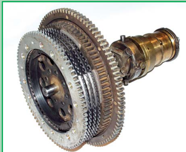
BUGATTI 46 2T r.v.1929 - kompletace