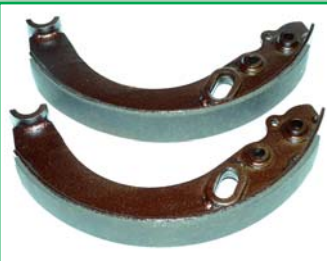
Bubnová brzda VOLVO