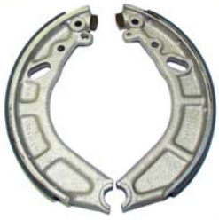
Renovace brzdových čelistí

Vyrábíme a renovujeme brzdové a spojkové komponenty pro historické automobily a motocykly. Používáme bezasbestové třecí materiály, které vzhledově napodobují původní. Technologii aplikace volíme dle požadavků zákazníka, tedy lepením či nýtováním. Pro sportovní oldtimery používáme materiály se zvýšenou tepelnou odolností, které jsou i při maximálním nasazení šetrné vůči ostatním částem brzdových či spojkových kompletů.