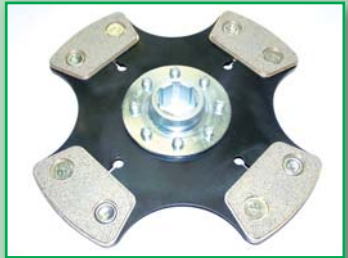
ŠKODA 1100 SPORT