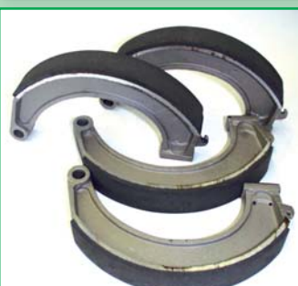
Renovace brzdových čelistí TATRA 75