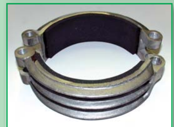
Čelistová brzda BMW