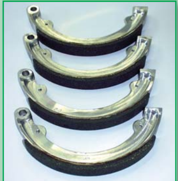
KAWASAKI 750 (tříválec, dvoutakt, r.v.1972)

Vyrábíme a renovujeme brzdové a spojkové komponenty pro historické automobily a motocykly. Používáme bezasbestové třecí materiály, které vzhledově napodobují původní. Technologii aplikace volíme dle požadavků zákazníka, tedy lepením či nýtováním. Pro sportovní oldtimery používáme materiály se zvýšenou tepelnou odolností, které jsou i při maximálním nasazení šetrné vůči ostatním částem brzdových či spojkových kompletů.