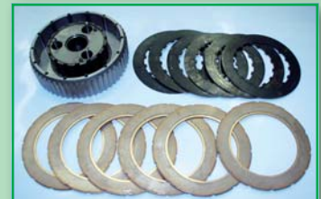
WESLAKE spojka - před kompletací