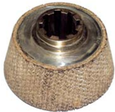
AERO - renovace kuželové spojky