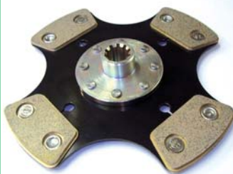
Spojková lamela ŠKODA 130 RS Triner, Sum, Hejhal